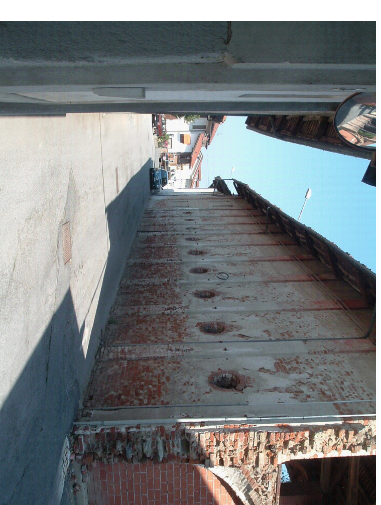
Foto 4 lato via Astegiana