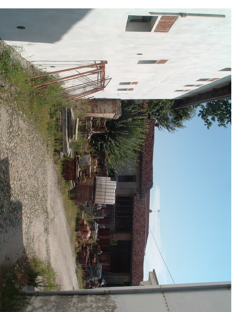
Foto 1 Ingresso attuale