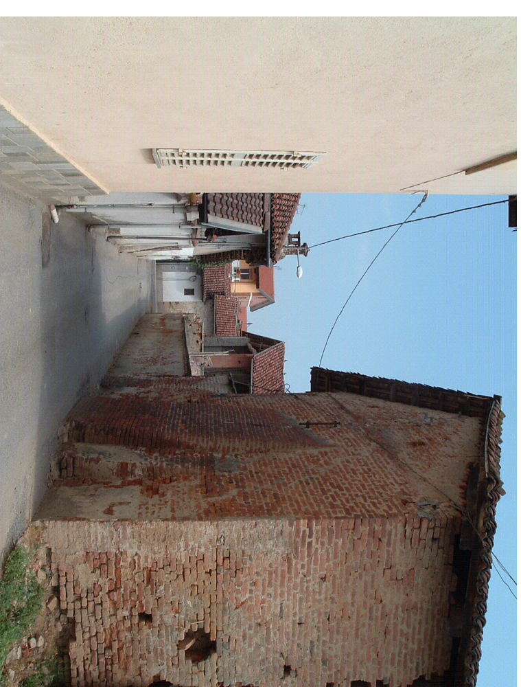
Foto 6 prima dell'ampliamento stradale