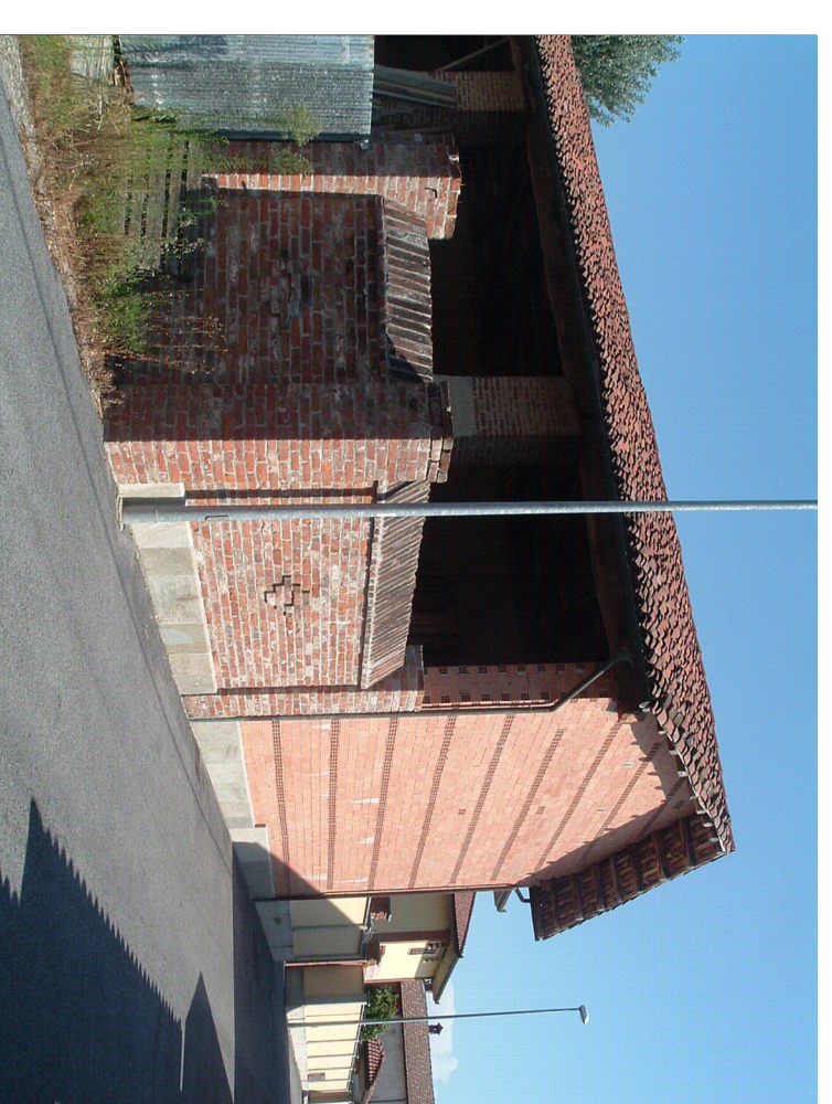
Foto 7 tettoia