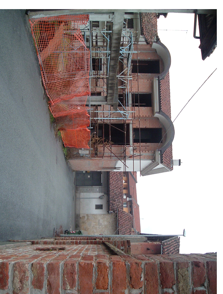
Foto 8 Vicolo del Pozzo dopo l'ampliamento