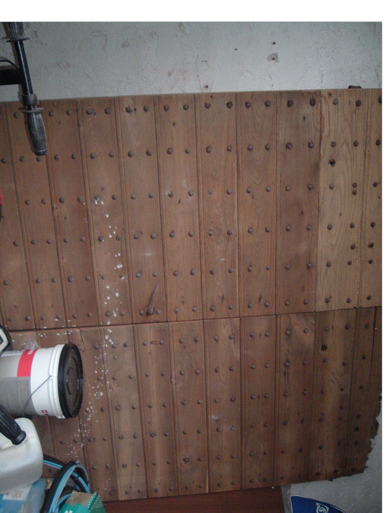
Foto portone stalla