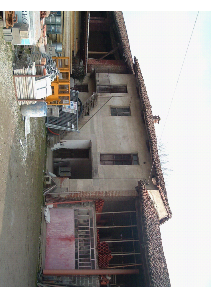
Foto 3 depositi su cortile