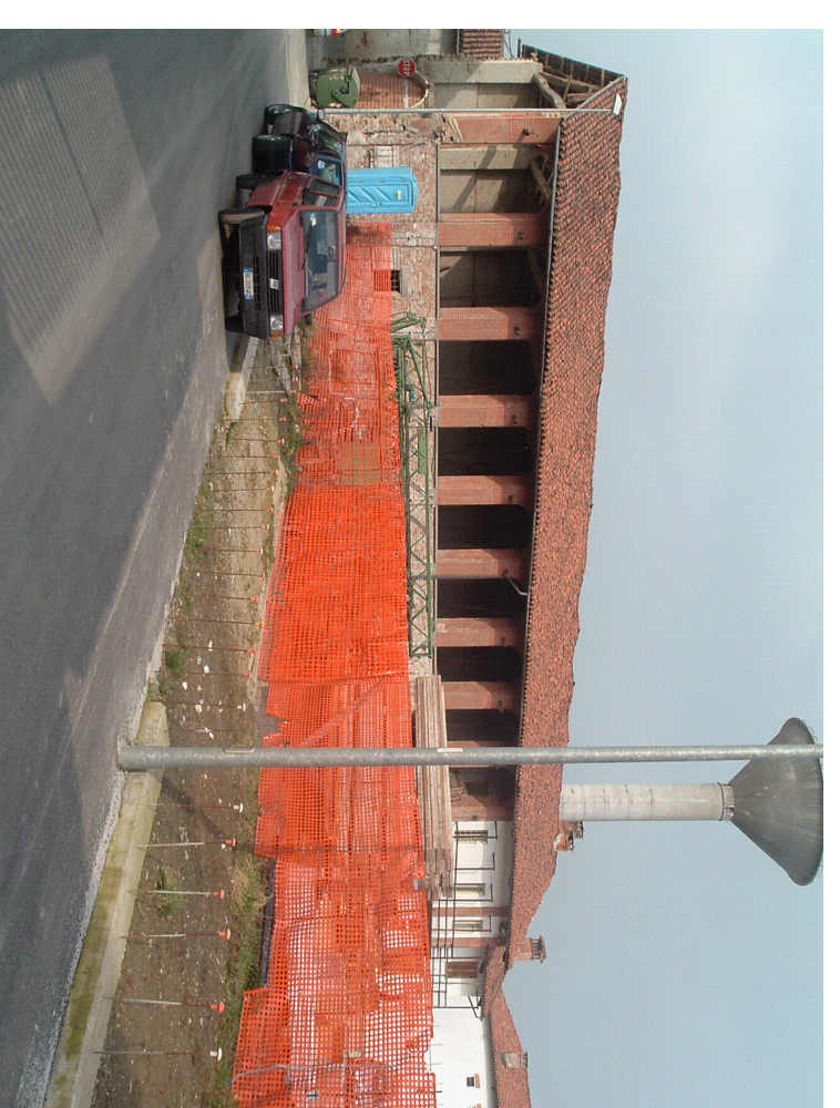
Foto 5 stalla e tettoia e Vio del Pozzo dopo la realizzazione dell'ampliamento stradale