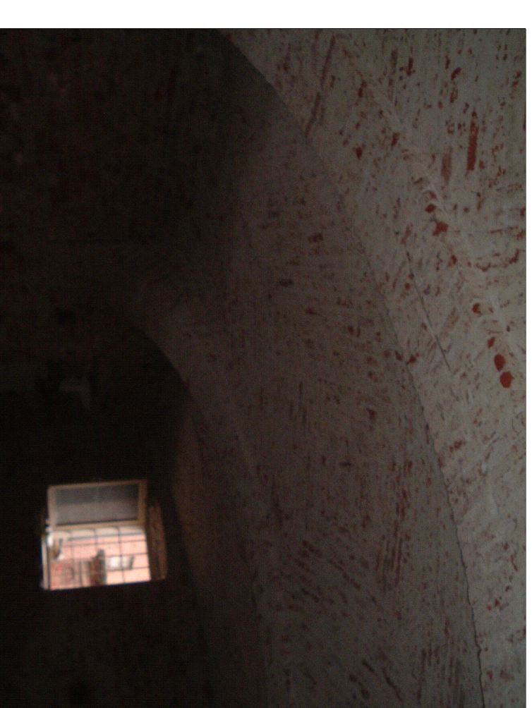
Foto soffitto abitazione