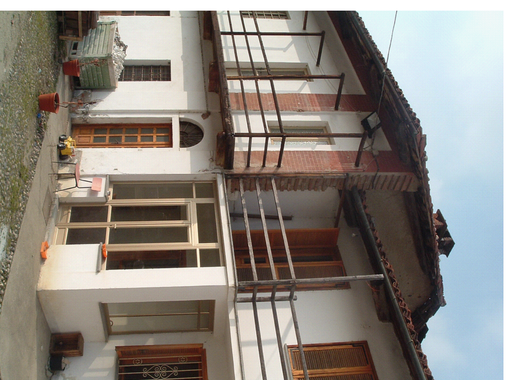
Foto 2 facciata abitazione