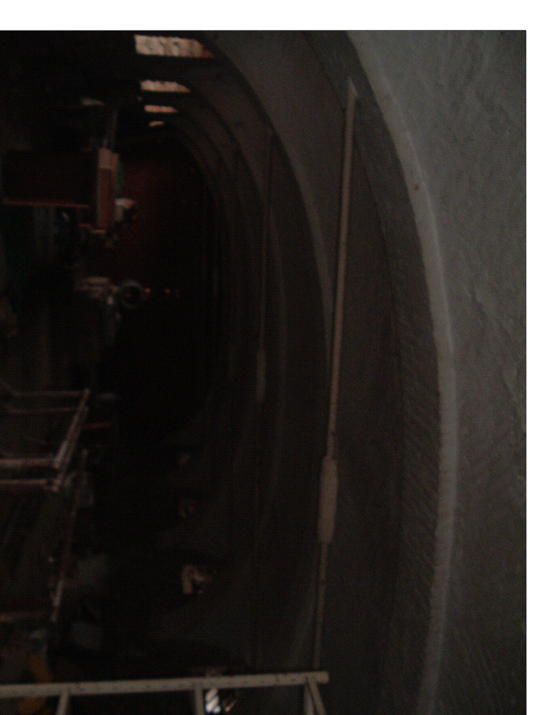
Foto soffitto stalla