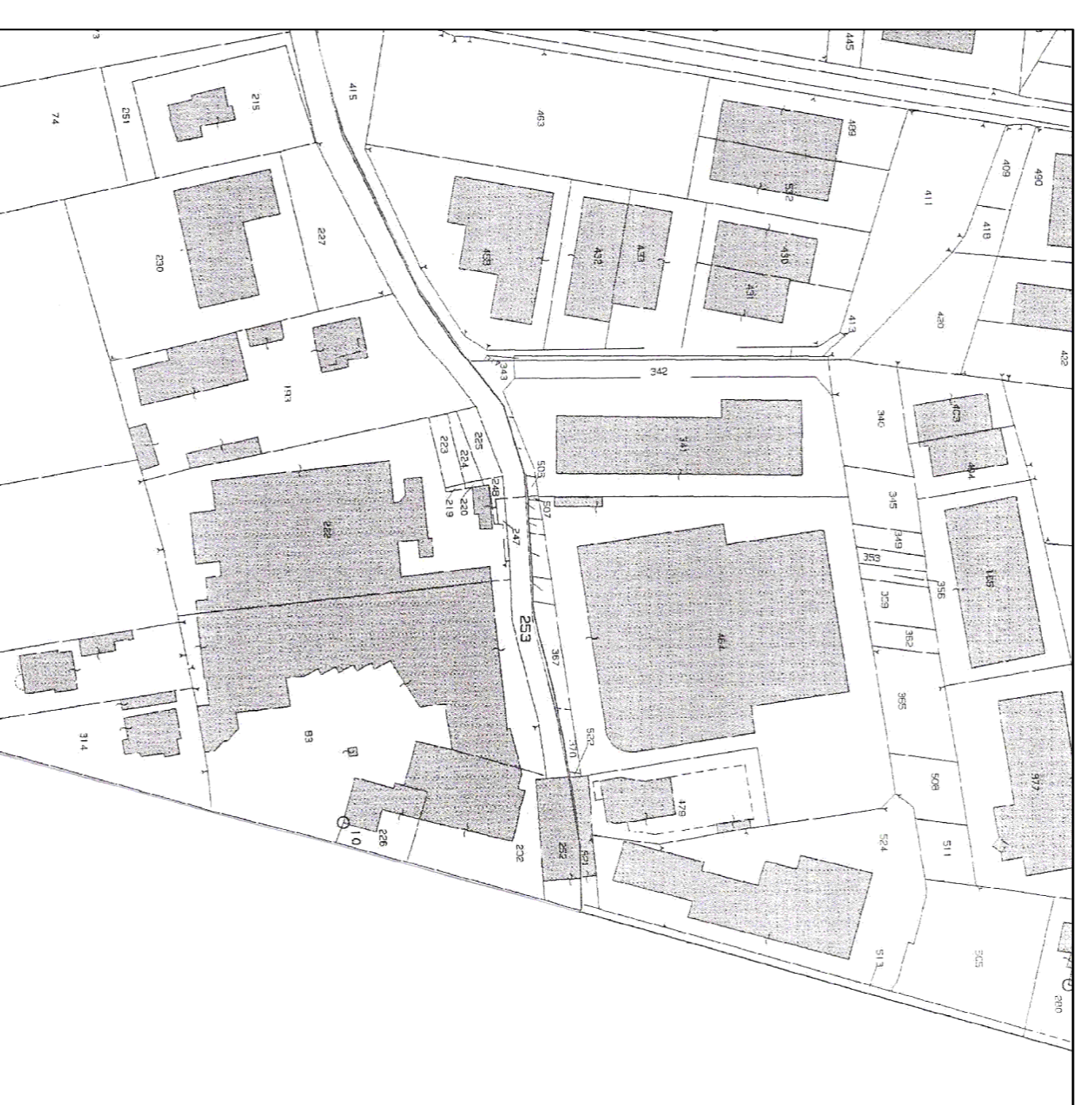
PLANIMETRIA CATASTALE Scala 1 : 2000