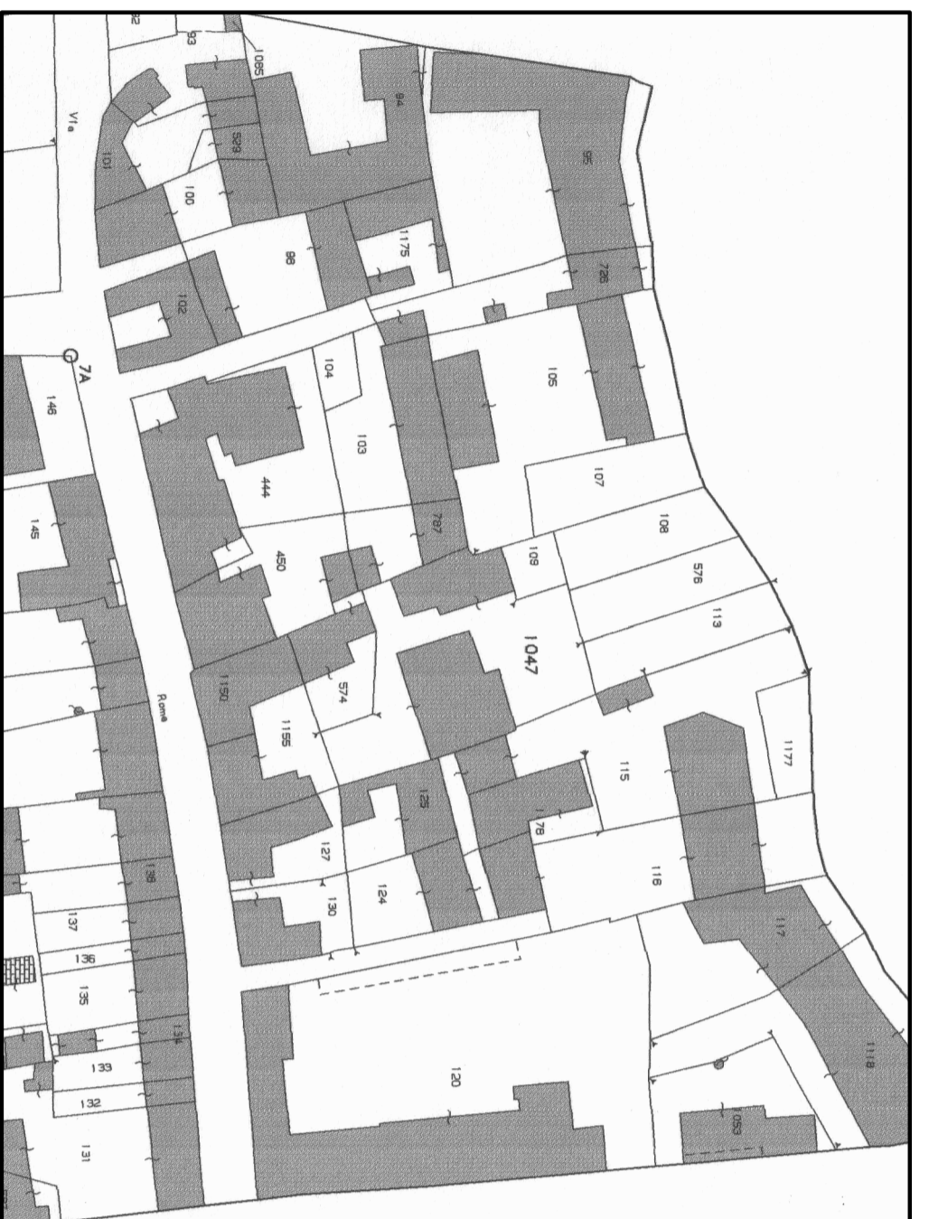
ESTRATTO MAPPA CATASTALE

DATA: Novembre 2014 | PRG: 0099 | ZONA: P.R.G.C. PR4 | I.M.: IL TECNICO | foglio: 12 | numeri: V01 | P.D.R. 1b RAPPRESENTAZIONI: DESCRIZIONE | ESTRATTO MAPPA PARTICOLARE | Scale: 1:1000 1:1000 1:200